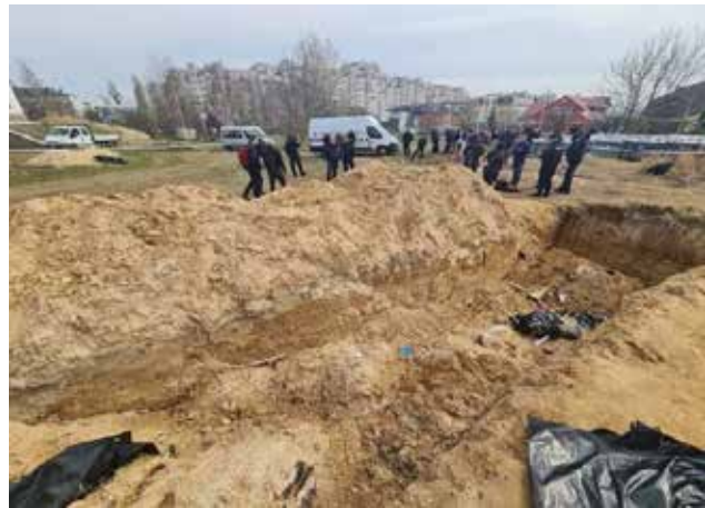
Рис. 1. Екзумація тіл з братської могили біля церкви у Бучі

Причиною загибелі цих людей стала російська артилерія, а деякі тіла не вдалося ідентифікувати [24]. Були помічені факти мародерства, здій-